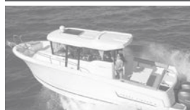
Merry Fisher 855 marlin