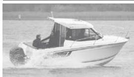
Merry Fisher 605