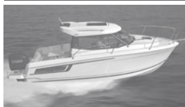
Merry Fisher 695