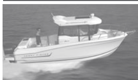
Merry Fisher 695 marlin