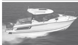
Merry Fisher 795