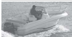
Cap Camarat 5.5 CC