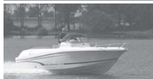
Cap Camarat 6.5 CC