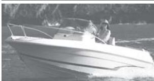
Cap Camarat 5.1 CC