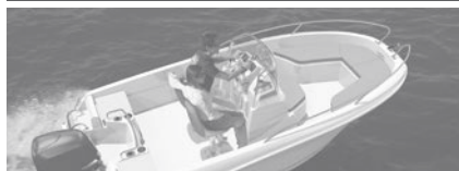
Cap Camarat 4.7 CC